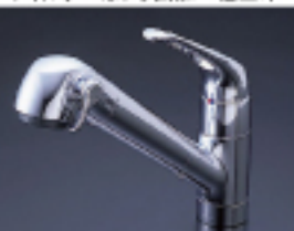
シングルレバーオールインワン浄水栓 (カートリッジ内蔵)