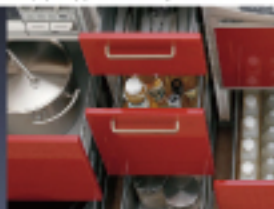
ソフトサイレンスレール (オーストリア プルム社製)