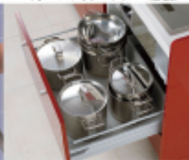
コンロ下スライド収納