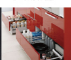
ベーススライド収納、ストック品 などの収納に便利。