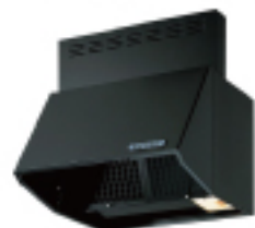
シロッコファンレンジフード フィルターはフッ素加工仕上げ