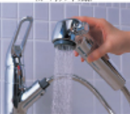
ハンドシャワー付