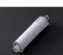
浄水専用カートリッジ 交換時期は4ヶ月に1度