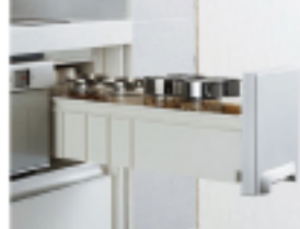
コンロ下に使い勝手のいい、 調味料などの小物収納ゾーン