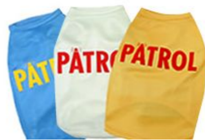
クールマックスの速乾性と気化熱による冷却効果によって、シャツを水に濡らして着ます。