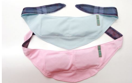
首にバンダナ・クールマックスで吸汗速乾素材+保冷剤

★犬の暑さ対策に有効なシャツは吸汗速乾性に優れたポリエステル多層構造の生地で、白やグレーや淡色などのシャツを選ぶと帽子や日傘のように直射日光と熱線を反射することができ、体温の上昇を大幅に下げることがあります。特に、黒毛や濃茶の毛の犬は熱を吸収しやすいのでシャツを着せる効果が非常に高く、吸汗速乾性が優れたクールマックスなどの素材を使ったシャツは、水を濡らすとその水分(液体)が蒸発して気体になる時に発生する気化熱の原理で犬の体温を奪って下げることが出来ます。